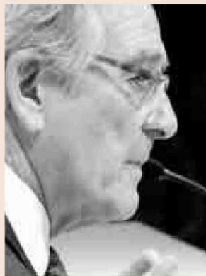
El alcalde de Barcelona, Xavier Trias.

Trias realizó esta petición a cinco meses de las elecciones municipales durante su intervención en el Col·legi de Periodistes, informa Efe .