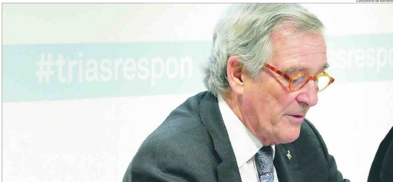
Xavier Trias expuso ayer los hitos y retos de su mandato en la tradicional conferencia del Colegio de Periodistas