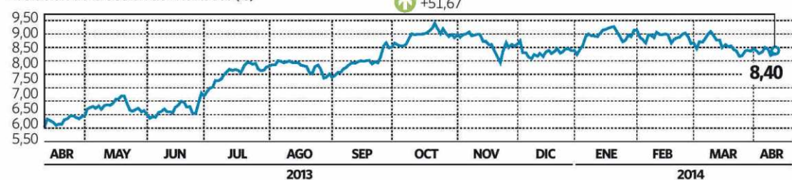
Evolución de la acción de Mediaset (€)