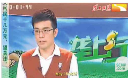
3. "Puc acabar?"