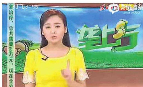
4. Una altra periodista el substitueix immediatament