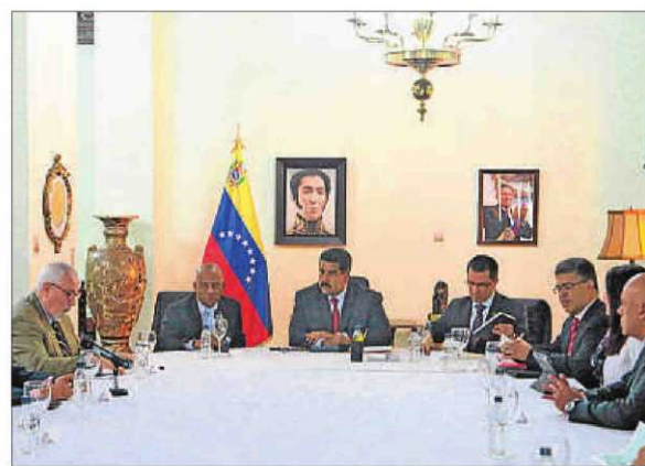
Nicolás Maduro parlant dimarts amb membres de l'oposició

Estava previst que a la cita acudissin el líder de la MUD i excan-