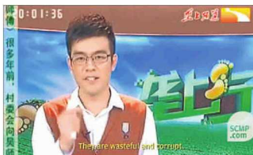
2. "Són molt malgastadors i corruptes"