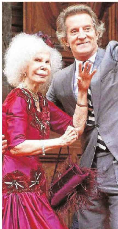
La duquesa de Alba y su marido en una boda el pasado octubre

La Sala confirma que la cadena de televisión tendrá que abonar 300.000 euros por difundir en el programa «Sálvame diario» una conversación telefónica mantenida por el matrimonio, con comentarios jocosos sobre la misma. El Supremo reitera la doctrina de que no se justifica la preponderancia de la libertad de expresión cuando no existe o es muy escaso el interés público de las manifestaciones, como ocurre en este caso, ya que se trataba de comentarios al hilo de una conversación privada, por