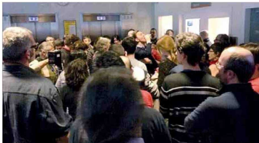
La protesta es va allargar durant hores