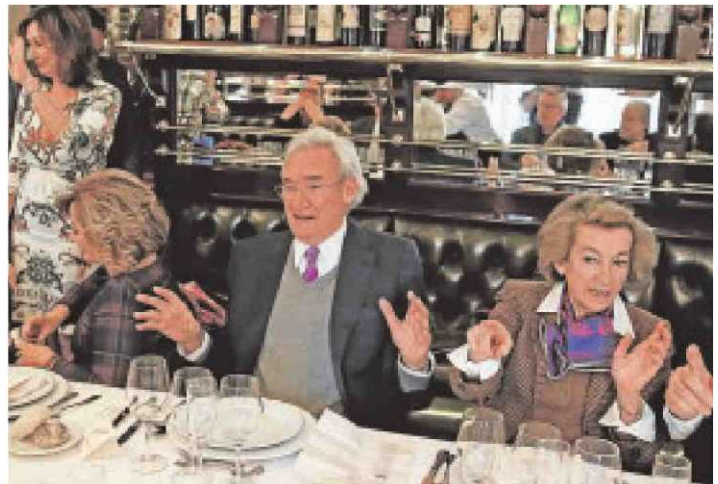
Luis del Olmo, protagonista del homenaje