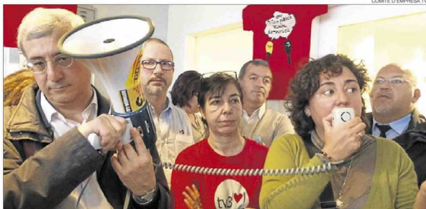
► Treballadors de TV-3 bloquegen la porta del despatx de la direcció de la cadena, ahir a Sant Joan Despí.