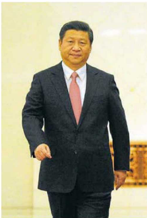
El president xinès, Xi Jinping, ha fet polítiques per silenciar els moviments opositors.