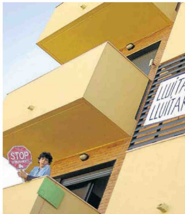
La Plataforma d'Afectats per la Hipoteca (PAH) promou una moció perquè els municipis sancionin els bancs amb pisos buits. DAVID BORRAT

Anunci L'Ajuntament de Barcelona compra 41 pisos per dedicar-los a lloguer social